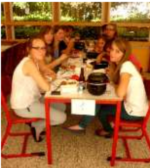
Un répit entre deux services